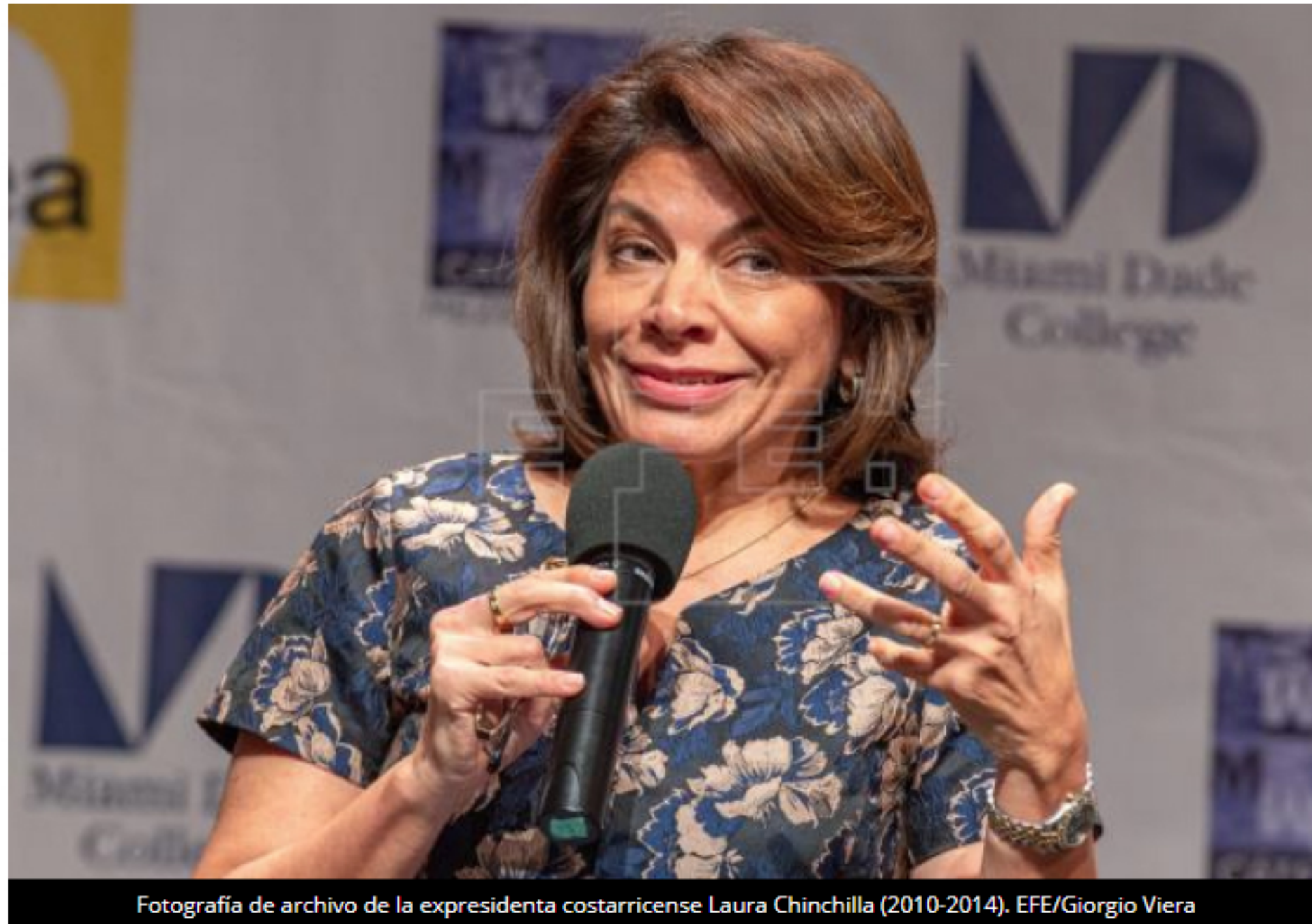
Fotografía de archivo de la expresidenta costarricense Laura Chinchilla (2010-2014).