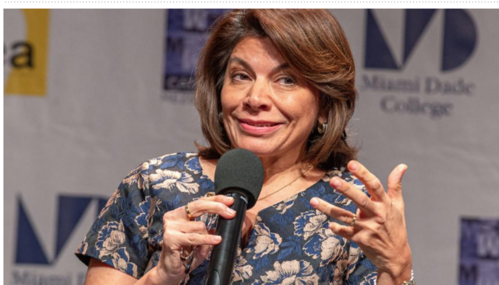
Chinchilla: Nicaragua, a punto de tener una dictadura como la norcoreana

Nueva York — 24 de septiembre de 2021 - 20:56h 0